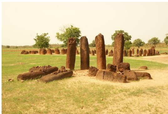
Wassu Stone Circle Keur Bamboung

Keur Bamboung es un campament basat en un projecte de conservació i repoblació de la fauna marina i els manglars. L'objectiu principal del campament ecoturístic es donar alternatives laborals a l'Àrea Marina Protegida de Bamboung (AMP). Los beneficios generats cubreixen les cargues del funcionament del AMP (salaris dels inspectors, benzina, manteniment del material, etc.) i permeten el desenvolupament sostenible de les comunitats rurals.