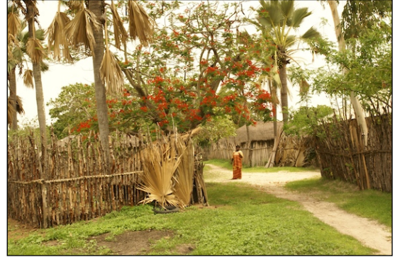
Poblats d'etnia Fula