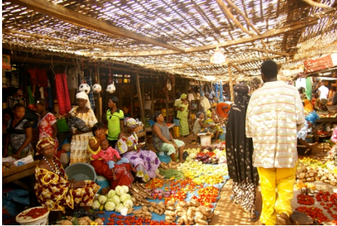
Mercat de Banjul

somriure, on descobrirem els poblats de pescadors i gaudirem de l'espectacle de l'arribada dels pescadors a la platja de Tanji. Visitarem el mercat tradicional de Banjul per realitzar les ultimes compres. Soparem a Sambou Ecolodge i ens dirigirem cap a l'aeroport.