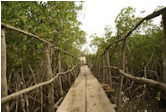
Bintang Bolong Lodge