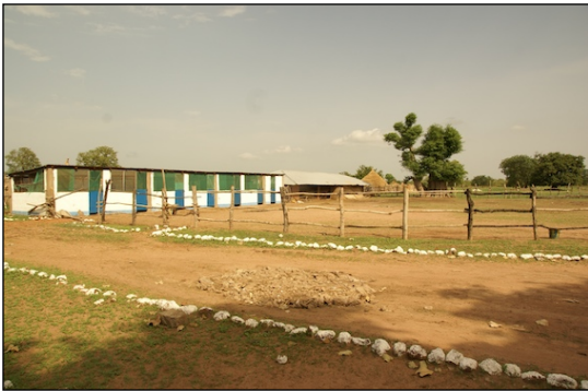
ONG, Horse and Donkey Trust