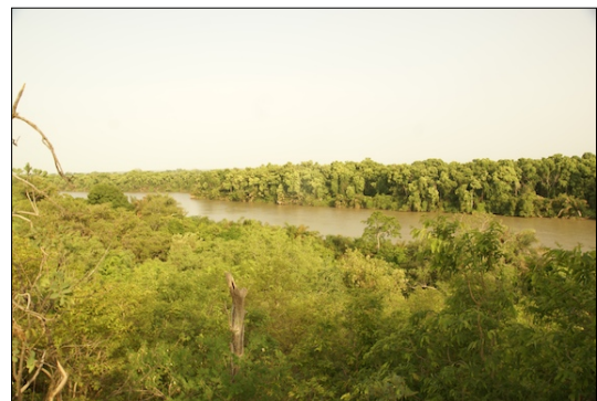
Vista del Riu Gàmbia