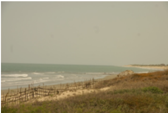
Platja de Tujereng