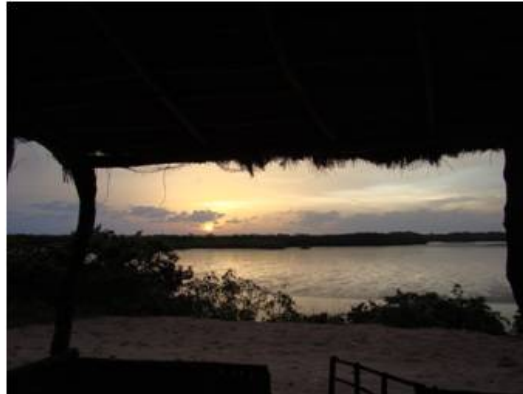
Vistes al Delta de Sine-Saloum