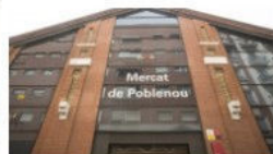
Aprenem a valorar l'alimentació fresca de Mercat