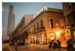
Descobrim les bambolines i els secrets del teatre