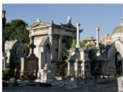
Passeig artístic per la vida i la mort