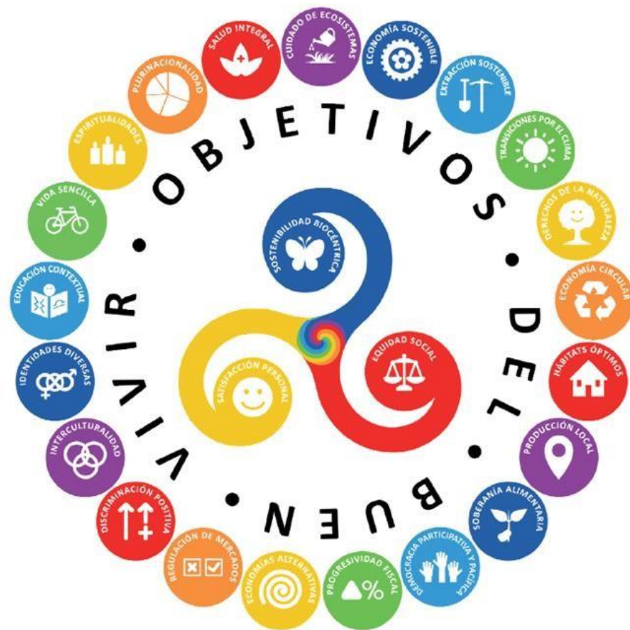
Gráfico 1 Los Objetivos del Buen Vivir a escala global