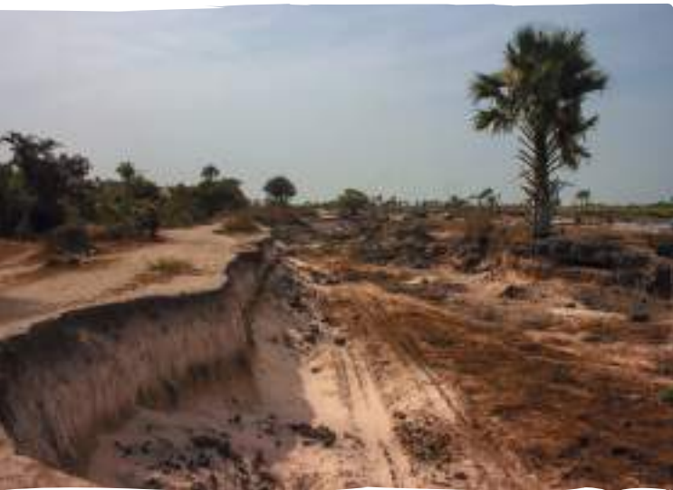
El turisme ha de donar resposta a l'emergència climàtica i repensar les lògiques del model extractivista actual.