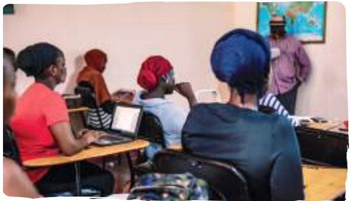
Participants del projecte a la formació sobre drets humans, laborals i de gènere.

És en aquest context que l'Institut de Turisme de Gàmbia (ITTOG) en partenariat amb l'Associació Ethnic i amb el suport de l'Agència Catalana de Cooperació al Desenvolupament (ACCD) hem posat en marxa el projecte No Woman Left Behind amb l'objectiu de formar i capacitar a dones en risc d'exclusió social com a professionals del turisme responsable i sostenible a Gàmbia, tot promovent l'exercici dels seus drets humans i de gènere.