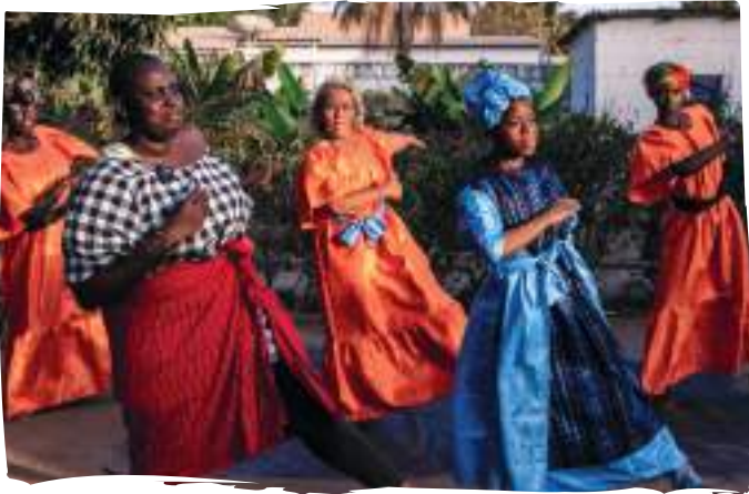
Activitats basades en l'intercanvi cultural que dinamitzen l'economia de petites empreses locals.

L'Associació Ethnic i l'Institut de Turisme de Gàmbia (ITTOG) treballen de forma conjunta des de l'any 2010 en processos d'articulació d'oferta turística de base comunitària. Això és, formes de turismes que posen en valor la cultura local, generen riquesa a les comunitats d'acollida i promouen la participació activa de les dones en espais de bona governança i presa de decisions.