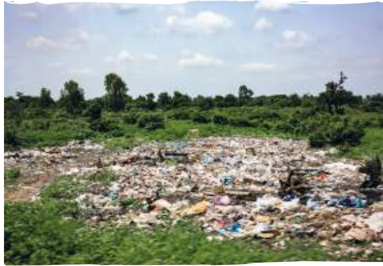
La gestió dels residus és un dels reptes més importants que ha d'abordar Gàmbia.

Tot i que Gàmbia prohibeix l'ús de bosses de plàstic, la manca d'estratègies de gestió de residus representa un perill urgent pel medi ambient i per la població local.