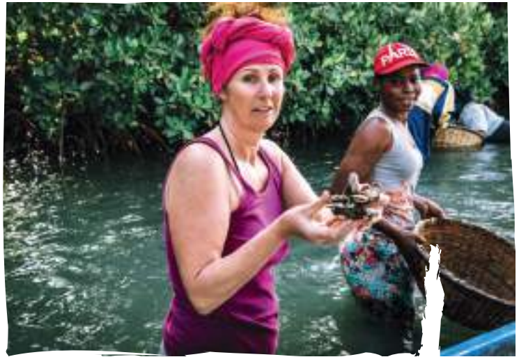
Activitats turístiques dissenyades en base a criteris de turisme responsable, amb enfocament de gènere i basat en drets humans.