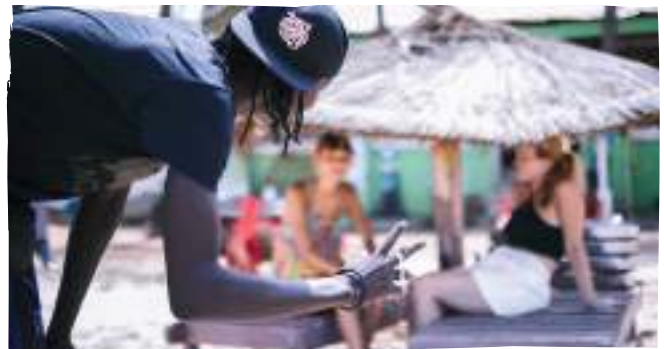
El model inclusiu busca integrar projectes locals en l'activitat turística actual.