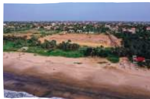
Prolifera les grans excavacions a les zones del litoral gambià perjudicant l'entorn natural.